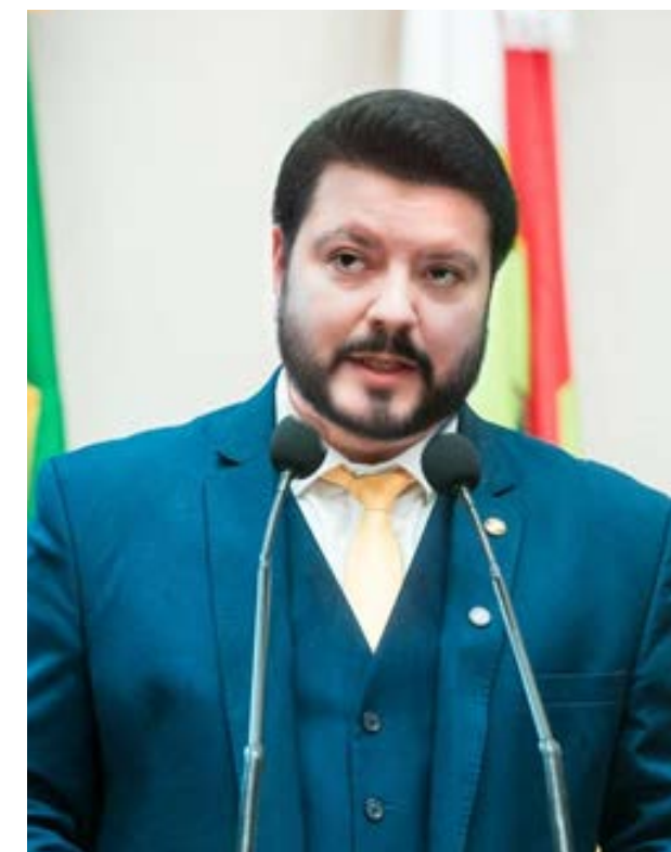
Deputado Alex Brasil, conosco na busca de nossa Identidade, legitimidade como UTILIDADE PÚBLICA.